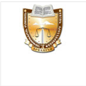
21.11.2014 ՀՀ ՓԱՍՏԱԲԱՆՆԵՐԻ ՊԱԼԱՏԻ ԽՈՐՀՈՒՐԴԸ ՀԱՄԱԼՐՎԵԼ Է ՆՈՐ ԱՆԴԱՄՆԵՐՈՎ