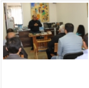
09.10.2013 ԱՎԱՐՏՎԵՑ «ՍՏՐԱՏԵԳԻԱՅԻ ԱՐՎԵՍԸ» ԹԵՄԱՅՈՎ ՎԵՐԱՊԱՏՐԱՍՏՄԱՆ ԴԱՍԸՆԹԱՑԸ