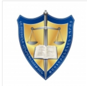
30.09.2013 «ՍՏՐԱՏԵԳԻԱՅԻ ԱՐՎԵՍԸ» ԹԵՄԱՅՈՎ ԴԱՍԱԽՈՍՈՒԹՅՈՒՆ