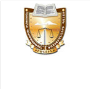
17.09.2013 ՍԵՊՏԵՄԲԵՐ ԱՄՍՎԱ ՎԵՐԱՊԱՏՐԱՍՏՄԱՆ ԴԱՍԸՆԹԱՑՆԵՐ