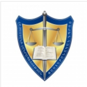
30.09.2013 ԴԱՍԸՆԹԱՑՆԵՐԻ ՓՈՓՈԽՈՒԹՅՈՒՆ