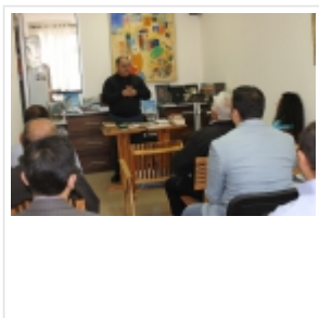
09.10.2013 ԱՎԱՐՏՎԵՑ «ՍՏՐԱՏԵԳԻԱՅԻ ԱՐՎԵՍԸ» ԹԵՄԱՅՈՎ ՎԵՐԱՊԱՏՐԱՍՏԱՆ ԴԱՍԸՆԹԱՑԸ