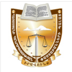
17.09.2013 ՍԵՊՏԵՄԲԵՐ ԱՄՍՎԱ ՎԵՐԱՊԱՏՐԱՍՏԱՆ ԴԱՍԸՆԹԱՑՆԵՐ