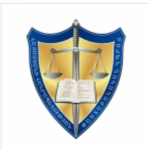
30.09.2013 ԴԱՍԸՆԹԱՑՆԵՐԻ ՓՈՓՈԽՈՒԹՅՈՒՆ