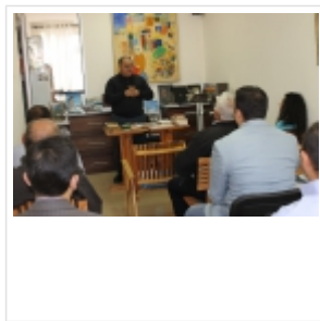
09.10.2013 ԱՎԱՐՏՎԵՑ «ՍՏՐԱՏԵԳԻԱՅԻ ԱՐՎԵՍԸ» ԹԵՄԱՅՈՎ ՎԵՐԱՊԱՏՐԱՍՏՄԱՆ ԴԱՍԸՆԹԱՑԸ