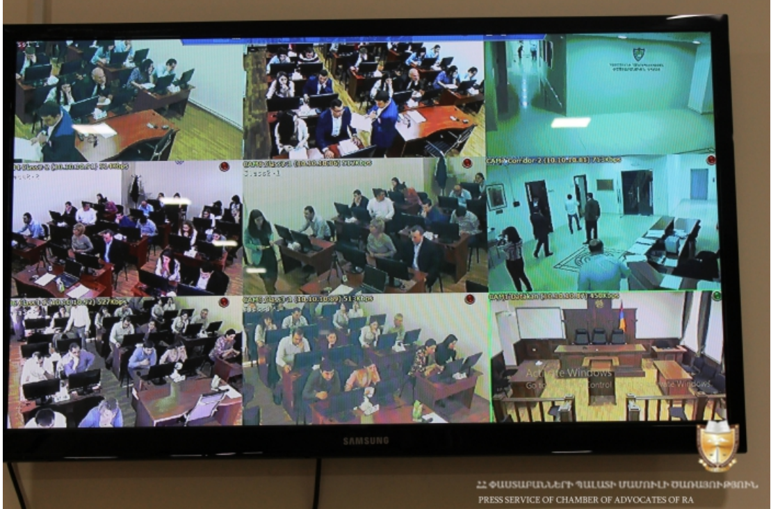
ՀՀ ՓԱՍՏԱՐԱԼԵՐԻ ՊԱՍՏԻ ՄԱՍԻՆԻ ԺԱՌԱՅՈՒԹՅՈՒՆ PRESS SERVICE OF CHAMBER OF ADVOCATES OF RA