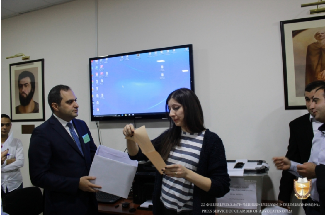
ՀՀ ՓԱՍՏԱՐԱԼԵՐԻ ՊԱՍՏԻ ՄԱՍԻՆԻ ԺԱՌԱՅՈՒԹՅՈՒՆ PRESS SERVICE OF CHAMBER OF ADVOCATES OF RA