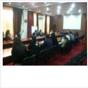
30.10.2015 ԱՆԱՆԻԱ ՇԻՐԱԿԱՑԻ ՎԱՐԺԱՐԱՆԻ ԱՇԱԿԵՐՏՆԵՐԸ ՀՅՈՒՐԸՆԿԱԼՎԵԼ ԵՆ ՓԱՍՏԱԲԱՆՆԵՐԻ ՊԱԼԱՏՈՒՄ

Վերադառնալ $(window).load(function(){ if(typeof $(".fb_comments_count").html() != "undefined" && parseInt($(".fb_comments_count").html()) != 0){ updateCommentsCount(window.location.href); } })