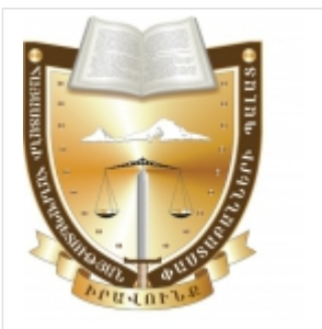
29.10.2013 ԱԿՈՒՄԲԻ ՆԻՍԻ ՀՐԱՎԵՐ