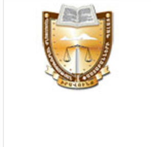
29.10.2014 STATEMENT REGARDING RA LAW PROJECT ON IMPEMETING AMENDMENTS AND ADDITIONS IN RA LAW ON TEMPORARY DISABILITY BENEFITS