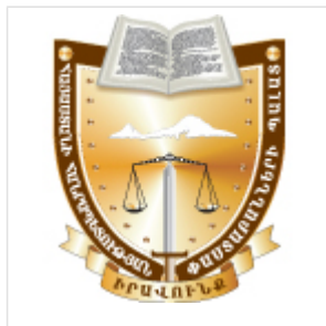
29.10.2014 STATEMENT REGARDING RA LAW PROJECT ON IMPEMETING AMENDMENTS AND ADDITIONS IN RA LAW ON TEMPORARY DISABILITY BENEFITS