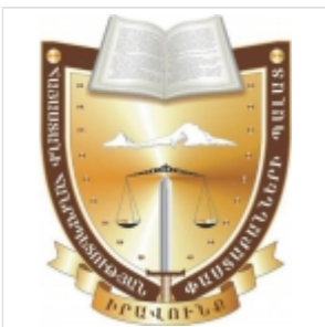
13.01.2017 ABOUT THE AFFIRMATION OF THE FORMS OF DOCUMENTS NECESSARY