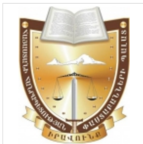
15.01.2017 IN CONNECTION WITH THE GENERAL SESSION ON THE ISSUE OF