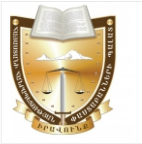
19.11.2013 ՇՆՈՐ ՀԱՎԱԼԱԿԱՆ ՆԱՄԱԿ ՓԱՍՏԱԲԱՆՆԵՐԻ ՊԱԼԱՏԻՆ