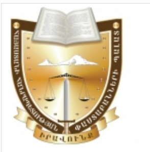
27.11.2013 ՓԱՍՏԱԲԱՆՆԵՐԻ ՊԱԼԱՏԸ ՔԱՂԱՔԱՑԻՆԵՐԻՆ ԻՐԱՎԱԲԱՆԱԿԱՆ ԽՈՐՀՐԴԱՏՎՈՒԹՅՈՒՆ