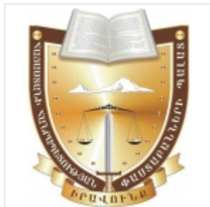
09.09.2016 ՍՅՈՒՆԻՔԻ ՄԱՐԶԻ ՓԱՍՏԱՔԱՆՆԵՐԻ