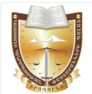
18.04.2015 «ՓԱՍՏԱԲԱՆԻ ՕՐ» ՍԱՀՄԱՆԵԼՈՒ ՀԱՐՑԸ ՔՆՆԱՐԿԵԼՈՒ ՄԱՍԻՆ»