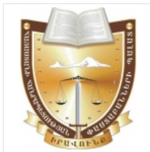
05.12.2014 ԿԱՅՔԻ ԱՇԽԱՏԱՆՔԻ ԺԱՄԱՆԱԿԱՎՈՐ ԸՆԴՀԱՏՈՒՄՆԵՐ