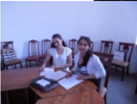
Նախորդ նորոգյունը: Շիրակի եւ սնունդի Մարզերում Մարզացի շահագործողներ ընտրելու շահարկ