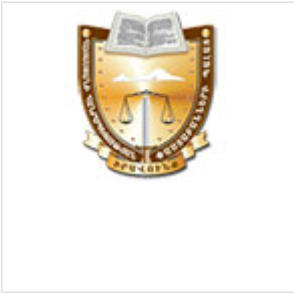
21.07.2017 ՀՀ ՓԱՍՏԱԲԱՆՆԵՐԻ ՊԱԼԱՏԻ ԽՈՐՀՈՒՐԴԸ ՓԱՍՏԱԲԱՆՆԵՐԻ ԻՐԱՎՈՒՆՔՆԵՐԻ ՊԱՇՏՊԱՆՈՒԹՅԱՆ ՀԱՐՑԻ ՎԵՐԱԲԵՐՅԱԼ ԿԱՅԱՅՐԵԼ Է ՈՐՈՇՈՒՄ