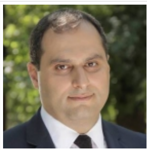
24.10.2013 ՓԱՍՏԱԲԱՆՆԵՐԻՑ ԽԼՈՒՄ ԵՆ 82 ՄԻԼԻՈՆ