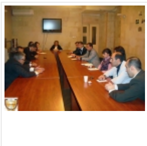
22.11.2013 ՓԱՍՏԱԲԱՆՆԵՐԻ ՊԱԼԱՏԻ ԱՎՈՒՄՐՈՒՄ ՔՆՆԱՐԿՎԵԼ Է ՓԱՍՏԱԲԱՆԱԿԱՆ ԳՈՐԾՈՒՆԵՈՒԹՅԱՆ ԻՐԱԿԱՆԱՑՄԱՆ ԱՌԱՆՁՆԱՀԱՏՎՈՒԹՅՈՒՆՆ ԵՐԸ