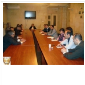
26.11.2013 ՔՐԵԱԿԱՆ ԴԱՏԱՎԱՐՈՒԹՅԱՆ ՄԱՍԻՆ ՕՐԵՆԱԳՐԻ ՆԱԽԱԳԾՈՒՄ ԱՌԿԱ ԵՆ ԱՅՆՊԻՍԻ ՀԱՏՎԱՆԻՇՆԵՐ, ՈՐՈՒՔ ՎՏԱՆԳԵԼՈՒ ԵՆ ՄԵՂԱԴՐՅԱԼԻ ՀԻՄՆԱՐԱՐ ԻՐԱՎՈՒՆՔՆԵՐԻ Լ