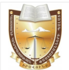
29.06.2016 ՄԱՐԶԱՅԻՆ ՀԱՄԱԿԱՐԳՈՂՆԵՐԻ ԵՎ