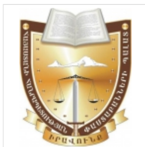
07.07.2016 ԱՐԱՐԱՏԻ, ԱՐՄԱՎԻՐԻ, ԿՈՏԱՅՔԻ ԵՎ