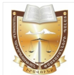
01.07.2016 ԱՐԱՐԱՏԻ, ԱՐՄԱՎԻՐԻ, ԿՈՏԱՅՔԻ ԵՎ