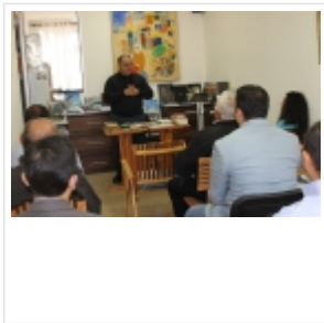
09.10.2013 ԱՎԱՐՏՎԵՑ «ՍՏՐԱՏԵԳԻԱՅԻ ԱՐՎԵՍԸ» ԹԵՄԱՅՈՎ ՎԵՐԱՊԱՏՐԱՍՏՄԱՆ ԴԱՍԸՆՏՈՒԹՅԱՆԸ