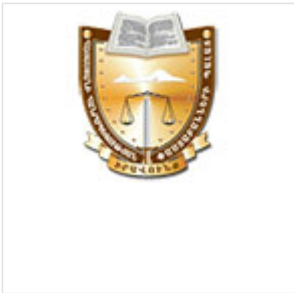
17.09.2013 ՍԵՊՏԵՄԲԵՐ ԱՄՍՎԱ ՎԵՐԱՊԱՏՐԱՍՏՄԱՆ ԴԱՍԸՆՏՈՒԹՅԱՆԵՐ