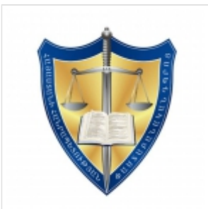
30.09.2013 ԴԱՍԸՆՏՈՒԹՅԱՆԵՐԻ ՓՈՓՈԽՈՒԹՅՈՒՆ