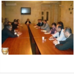
22.11.2013 ՓԱՍՏԱԲԱՆՆԵՐԻ ՊԱԼԱՏԻ ԱԿՈՒՄԲՈՒՄ ՔՆՆԱՐԿՎԵԼ Է ՓԱՍՏԱԲԱՆԱԿԱՆ ԳՈՐԾՈՒՆԵՈՒԹՅԱՆ ԻՐԱԿԱՆԱՑՄԱՆ ԱՌԱՆՁՆԱՀԱՏԿՈՒԹՅՈՒՆՆ ԵՐԸ