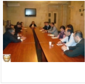
26.11.2013 ՔՐԵԱԿԱՆ ԴԱՏԱՎԱՐՈՒԹՅԱՆ ՄԱՍԻՆ ՕՐԵՆՍԳՐՔԻ ՆԱԽԱԳԾՈՒՄ ԱՌԿԱ ԵՆ ԱՅՆՊԻՍԻ ՀԱՏԿԱՆԻՇՆԵՐ, ՈՐՈՆՔ ՎՏԱՆԳԵԼՈՒ ԵՆ ՄԵՂԱԴՐՅԱԼԻ ՀԻՄՆԱՐԱՐ ԻՐԱՎՈՒՆՔՆԵՐԻ Ա ԱԶԱՏՈՒԹՅՈՒՆՆԵՐԻ ԻՐԱԿԱՆԱՑՈՒՄԸ